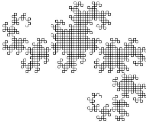
図6 Dragon 曲線