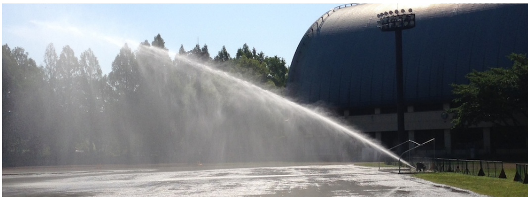
図 3 グランドの撒水。夏の到来だ。

演習 6 画像ファイル image/watering.jpg を「プレビュー.app」を使って ( [ファイル][書き出し...] )、PNG ファイル image/watering.png に書き出し、図として貼り込んだものを仕上がりの \text{L}^{\text{A}}\text{T}_{\text{E}}\text{X} 文書に含めなさい。ただし、適当な図の説明 ( キャプション ) を書き、 scale は適当に調整する。