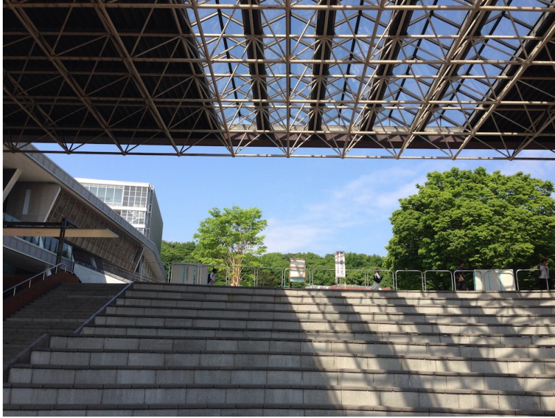
図 2 大東の広場を見上げる