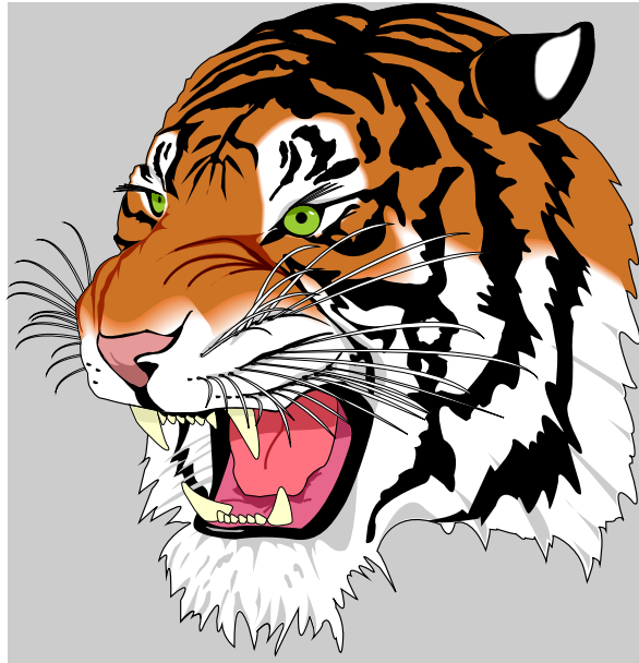
図 1 EPS 形式の有名なサンプル画像 tiger.eps [1]