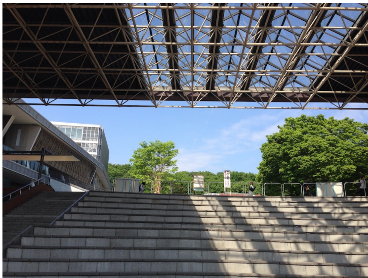
図 2 大東の広場を見上げる

演習 5 画像ファイル big_roof.jpg を図として貼り込んだものを仕上がり of L A T E X 文書に含めなさい。ただし、適当な図の説明 (キャプション) を書き、大きさは適当に調整する。