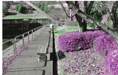
図 5 中庭の池と花